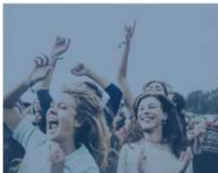
школьники, молодежь СЗФО