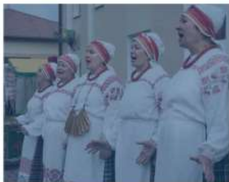
представители творческих сообществ