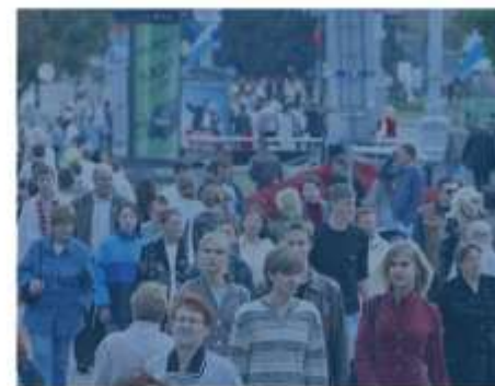
жители поморского севера